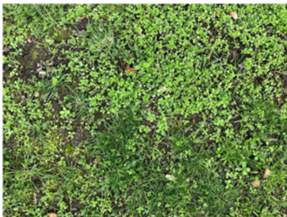
Uplejet areal ud for nr. 11

Græsplejen har også den virkning af græsset sætter frø. I november 2019 var der frø i græsarealet ud for nr. 25, 27, 29 og 31.